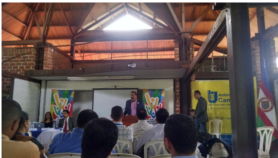
Imagen de la Audiencia Pública de Rendición de Cuentas

Para la audiencia pública de rendición de cuentas de la Institución Universitaria Antonio José Camacho se realizó el día 4 de mayo de 2017 en el horario de 9am a 12.30pm en el ágora de la Sede Sur de la Institución.